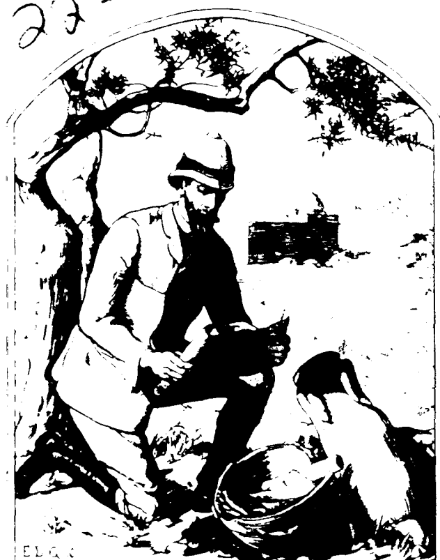
עקד הספרים של אלחנן הכהן אדלר

These images are from the collection of the Library of the Jewish Theological Seminary (JTS). JTS holds the copyrights to these images. The images may be downloaded or printed by individuals for personal use only, but may not be quoted or reproduced in any publication without the prior permission of JTS.