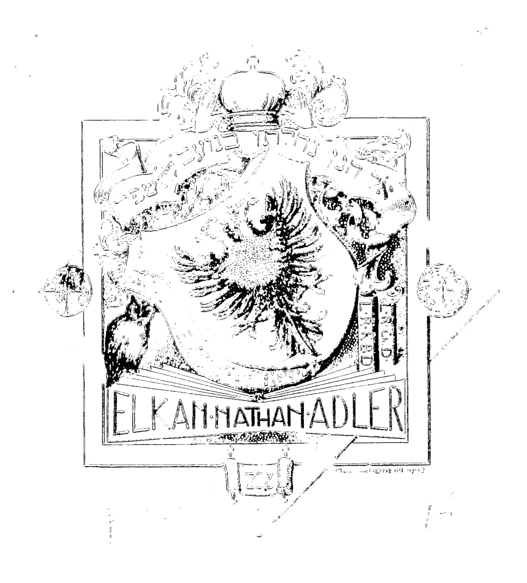
LIBRARY OF THE JEWISH THEOLOGICAL SEMIMARY OF AMERICA