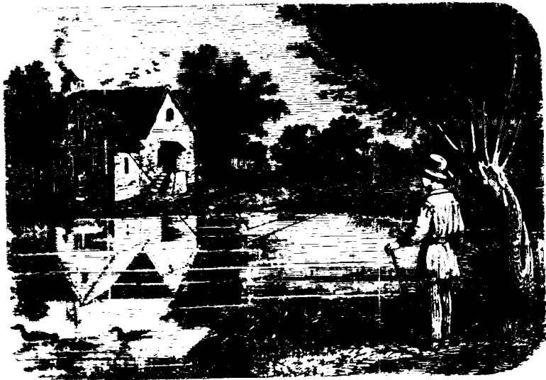
Фиг. 161. Отраженіе на поверхности воды.

265. Отраженіе прозрачныхъ тѣлъ. Вы видите, что стекло, не смотря на свою прозрачность, отражаетъ довольно свѣта для составленія изображеній — хотя слабыхъ, но чистыхъ и ясныхъ. Тоже самое нужно сказать о водѣ и о другихъ прозрачныхъ жидкостяхъ. Напримѣръ на берегу озера или рѣки мы видимъ опрокинутыя изображенія предметовъ находящихся на противоположномъ берегу. Мы говоримъ опрокинутыя изображенія, соображаясь съ тѣмъ, какъ намъ кажется, но вѣрнѣе нужно было бы сказать симметрическія изображенія, основываясь на вышенъизложенномъ замѣчаніи (264).