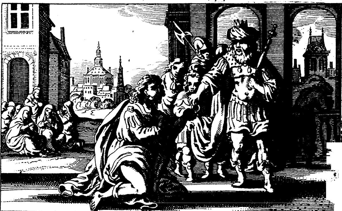
Haman verkryght des Koninghs Segel-ring, om uyt te schrijven den ondergangh der I. Esther. 3. 10.

ויהי כי חסדך יגדלך . ויהי כי חסדך יגדלך . ויהי כי חסדך יגדלך .