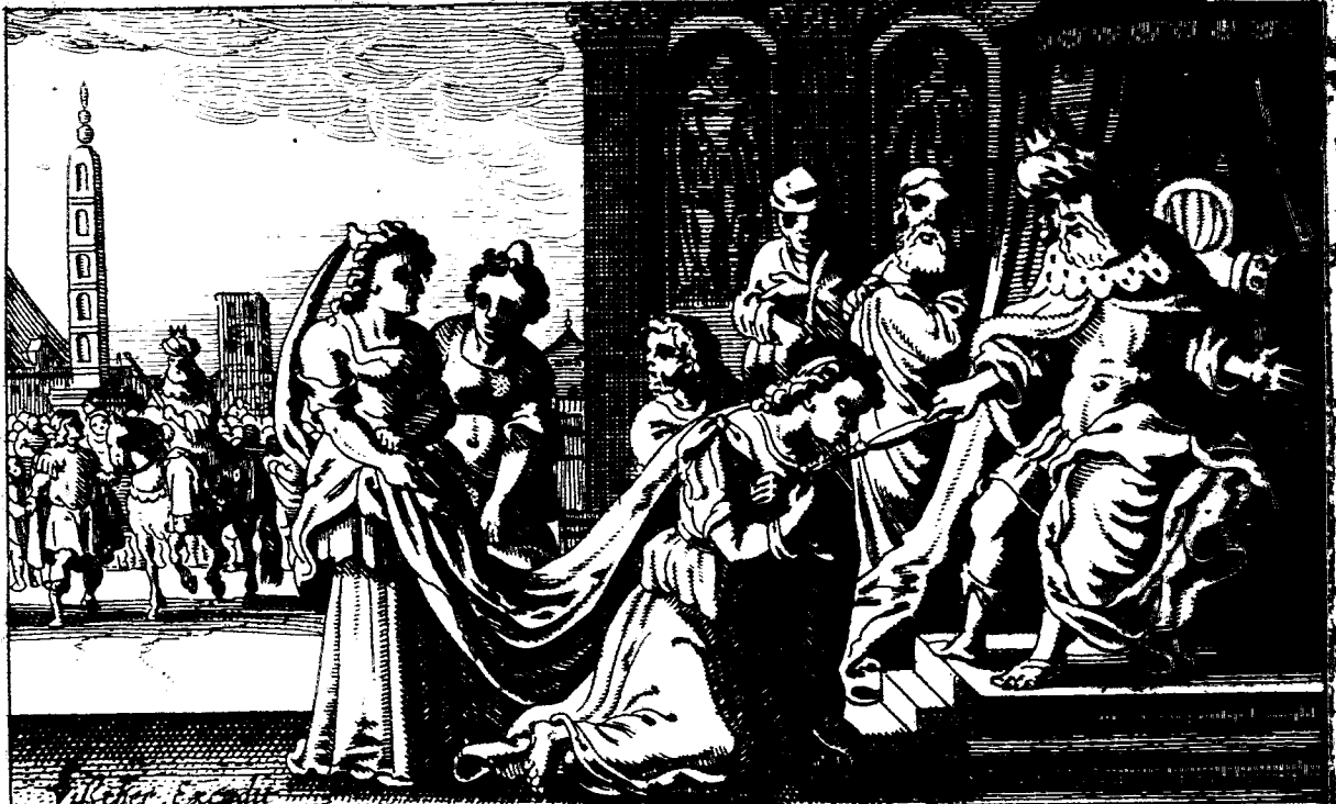
Esther gaet tot den Koningh Ahasueros. vint genade. nodight hem en Haman ter maeltijt Esther. 2.

והכלו רעים אצל המלך. וידעו הפרסים ושמחה שמעו אלה שמחתכם הקבוצים זכרו. ושלמו מלאכת לוי נבון