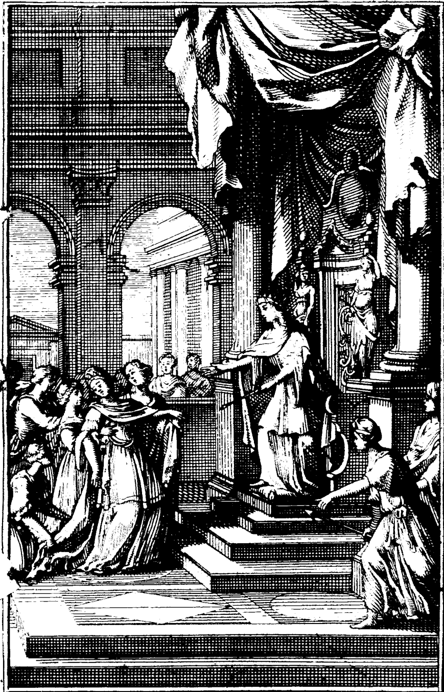
ESTHER, Tragedie. Par M r de RACINE .

ב'עלמ' בית רם ונ'עלמ' אל'יר אל'יר'ים א'חל' ל'כ'ת'ר'ת' מ'ע'ב'ר'ת' פ'יר'ים: