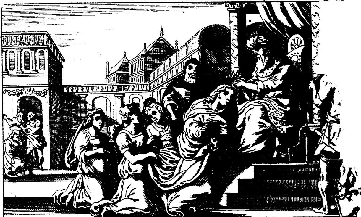
Ahasueros kroont Esther tot Koningin. Mordechai ondeckt een verraet tegen de Coningh. Esther. 2. 17.

והלך חסדך אל צדק המעלה מנצח ופ' הו"א מן פנ"ק ופ' הו"א מן פנ"ק